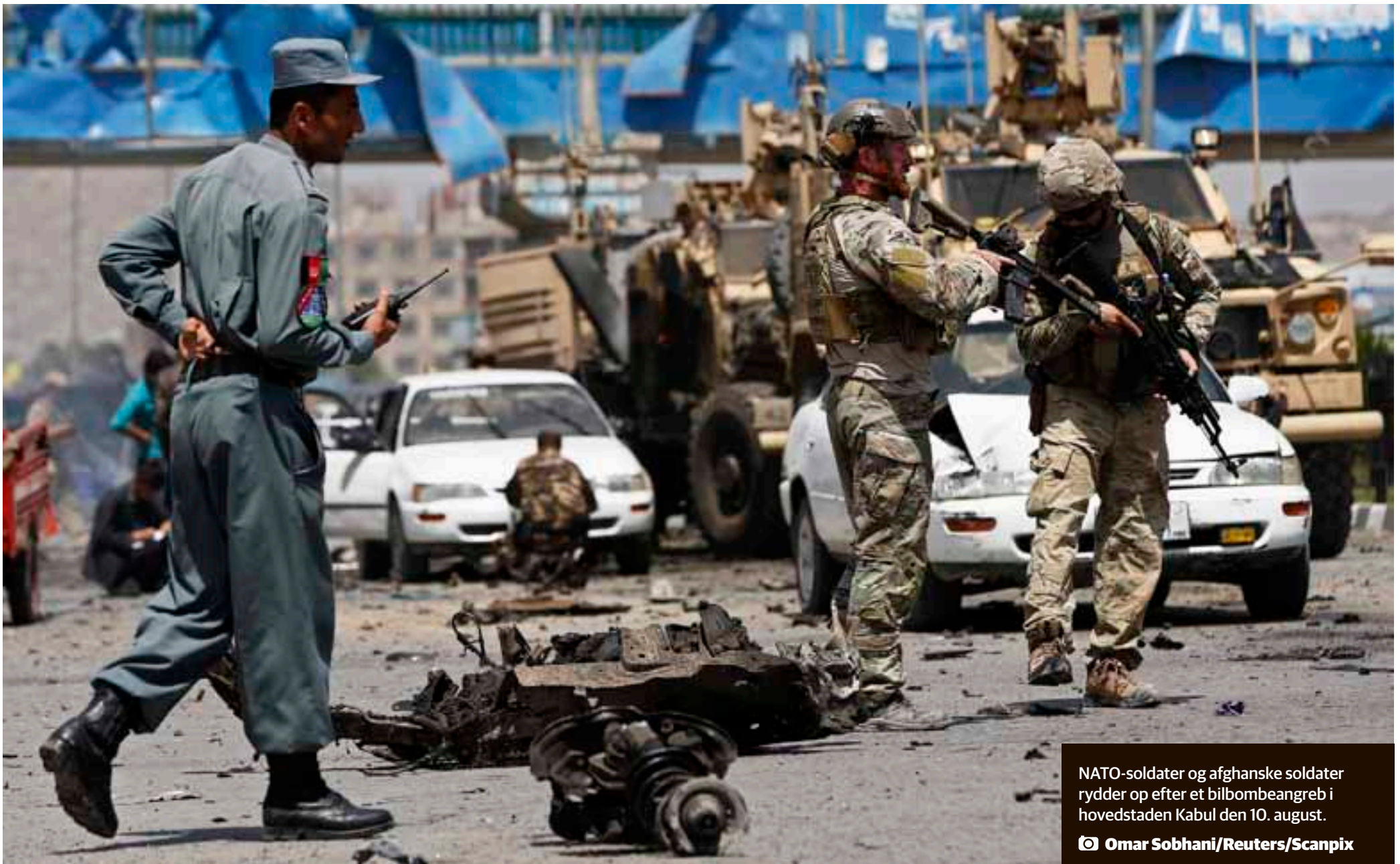
NATO-soldater og afghanske soldater rydder op efter et bilbombeangreb i hovedstaden Kabul den 10. august.