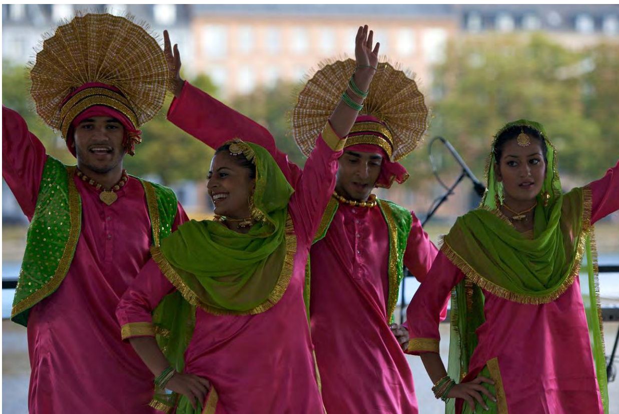
Indiske dansere ved Københavns Internationale Dag 2009. SOS mod Racisme, København, har været med ved Københavns Internationale Dag de sidste 5 år

Julebazar på Nørre Allé 7, Kbh. N., kl. 12 - 17 VerdensKulturCentrets Kvindeforum. Koncerter, salg af smykker, brocher, design, originale tasker, trikotage, découpage, julepynt, nyttige urter og krydderier.