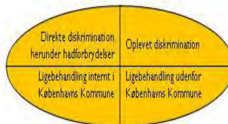
Anti-diskriminations- og Ligebehandlingsindsatsen

diskrimination, den interne ligebehandling og ligebehandlingen uden for kommunens eget domæne. For hver af de fire stykker får I både mine politiske overvejelser og vores konkrete initiativer.