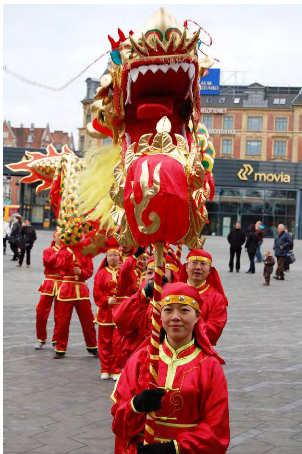
Orientalisk nytår på Københavns Rådhusplads

Orientalisk nytårsfest, Pesach, lykønskninger til de københavnske jøder og Eid fest på Københavns Rådhusplads. Det er blot nogle af mange højtider, som VI KBH'R'-kampagnen markerer og fejrer i 2009. Det er Københavns Kommune, som står bag kampagnen, der skal styrke fællesskabet og dialogen blandt byens borgere